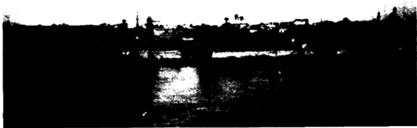
منظره بغداد و رودخانه دجله