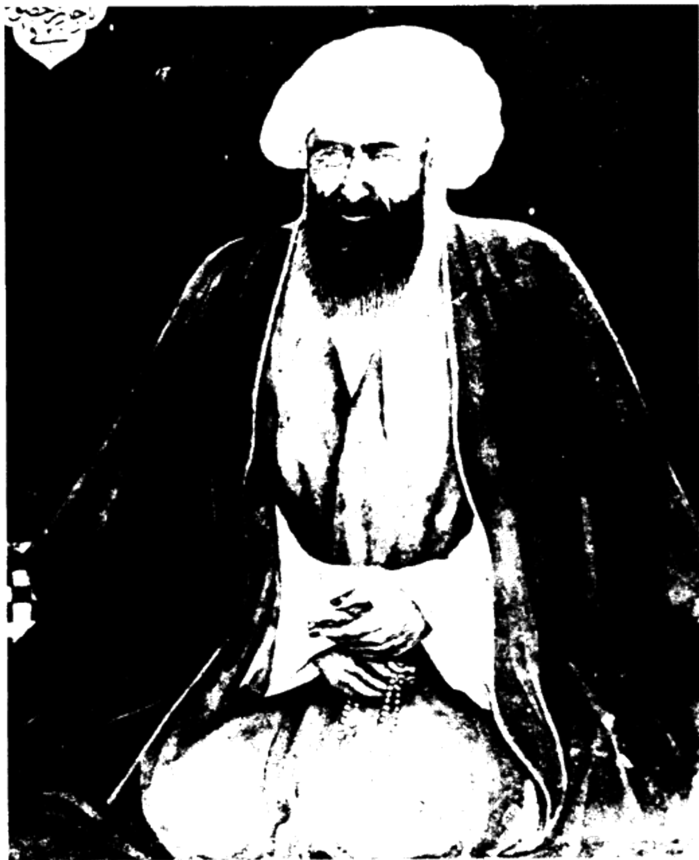
شیخ مرتضی انصاری مرجع تقلید شیعیان جهان (وفات ۱۸۶۴)

آن حضرت تعیین شده بود به اسلامبول عزیمت نمایند. اصحاب جمال مبارک در این زمان بی خبر از این تحولات کماکان به کسب فیض از محضر مبارک در مدینه بغداد خشنود و دلشاد بودند.