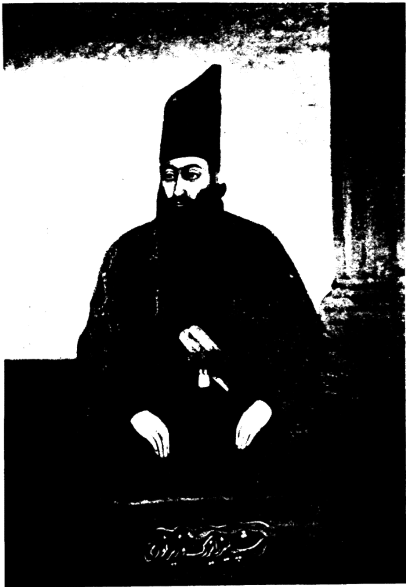
جناب میرزا عباس وزیر، پدر حضرت بهاء الله