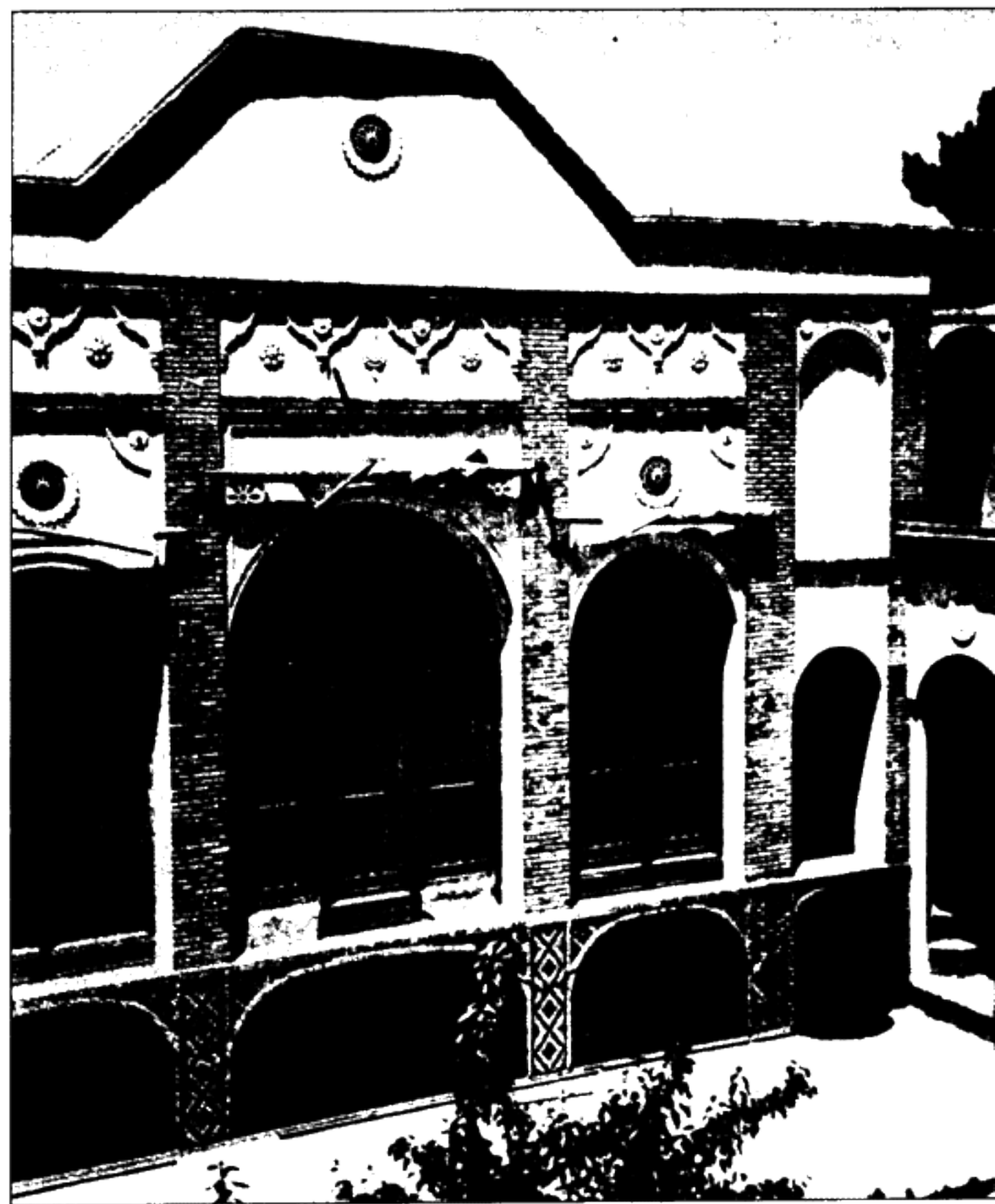
بیت حضرت بهاء‌الله در طهران