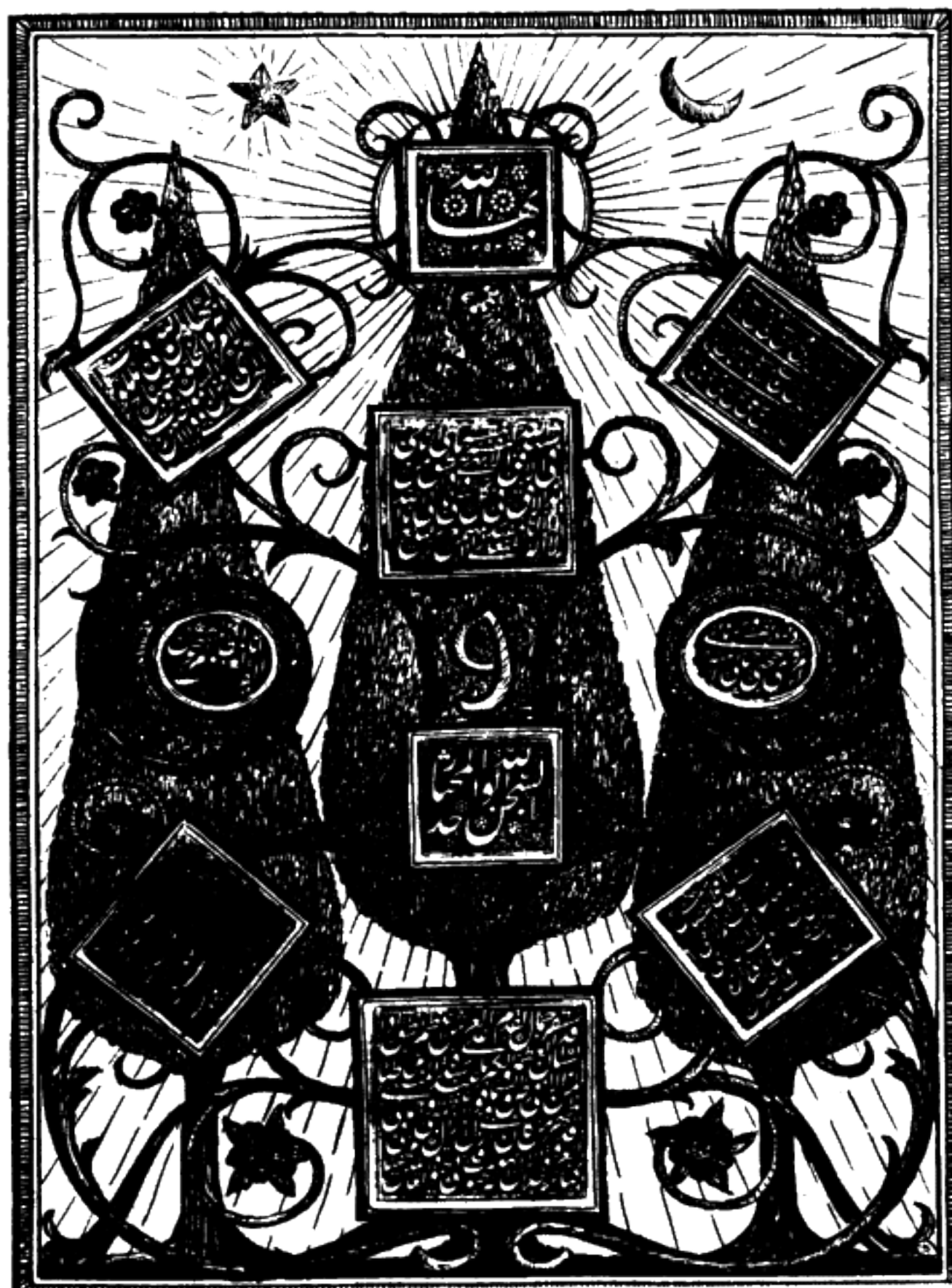
مُهرهای حضرت بهاءالله