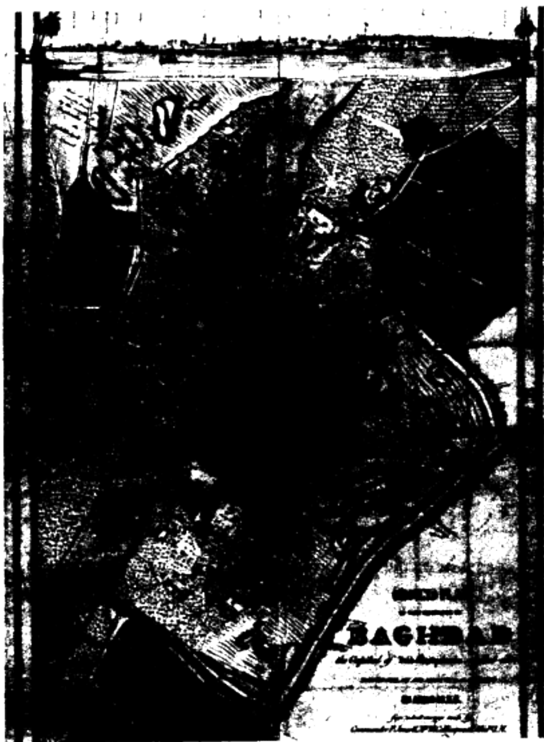
نقشه بغداد در سالهای ۱۸۵۳-۱۸۵۴

محله کرخ محل سکونت جمال مبارک در ساحل غربی رود دجله قرار دارد