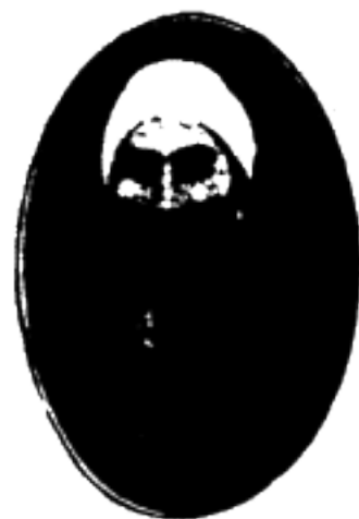
جناب میرزا موسی کلیم برادر جمال مبارک